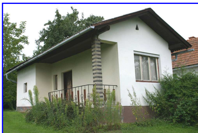
Bergkeller in Winten-Weinberg